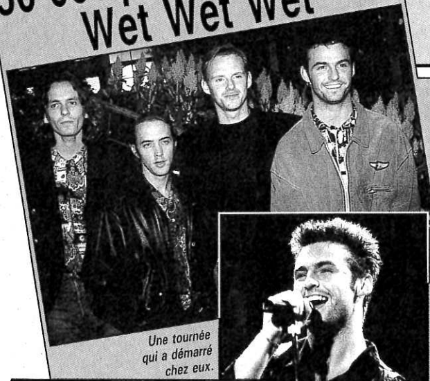
Une tournée qui a démarré chez eux.

Tout ce que vous voulez savoir sur vos vedettes Minitel 36 15 OK