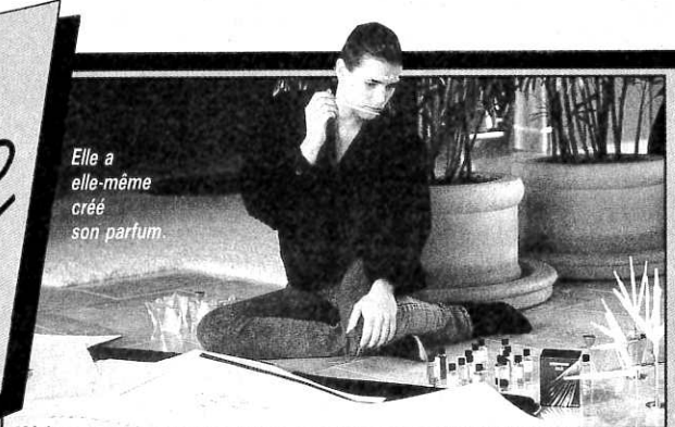
Elle a elle-même créé son parfum.