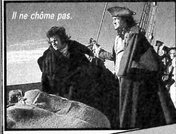
Il ne chôme pas.