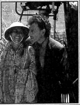
Souchon et Joy, la réalisatrice.